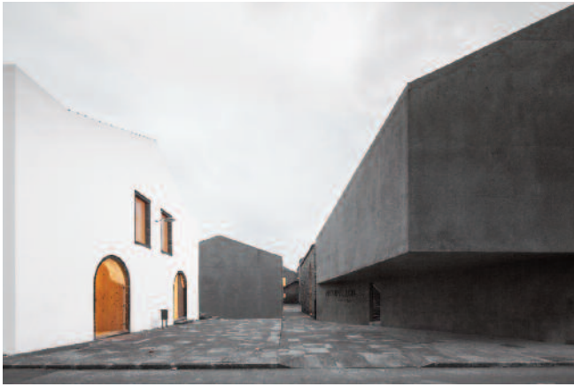
1 — Arquipélago – Centro de Artes Contemporâneas, Ribeira Grande, João Mendes Ribeiro e Menos é Mais (Cristina Guedes e Francisco Vieira de Campos)