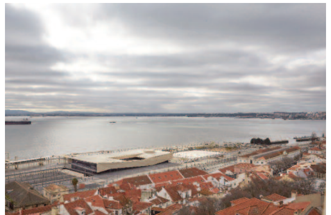
12 — Terminal de Cruzeiros de Lisboa, João Luís Carrilho da Graça.