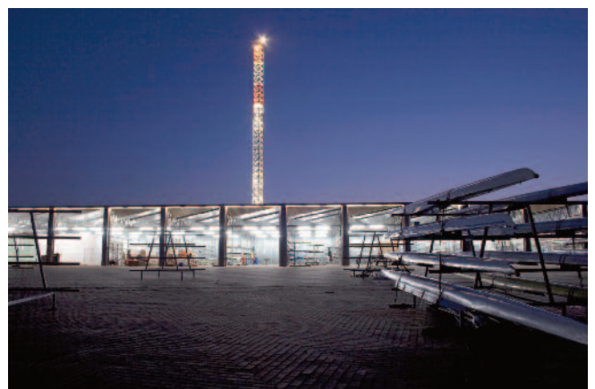
6 — Hangar Centro Náutico, Montemor-o-Velho, Miguel Figueira.