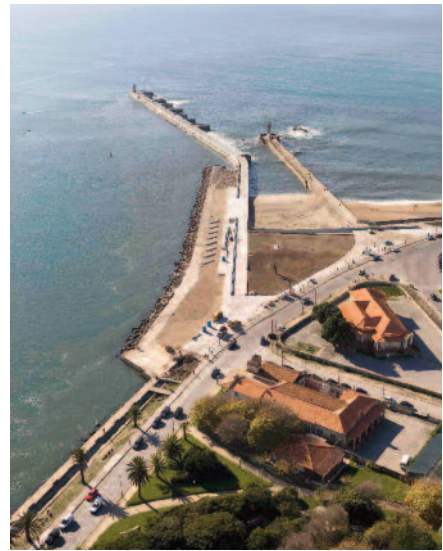
8 — Molhes do Douro, Carlos Prata.