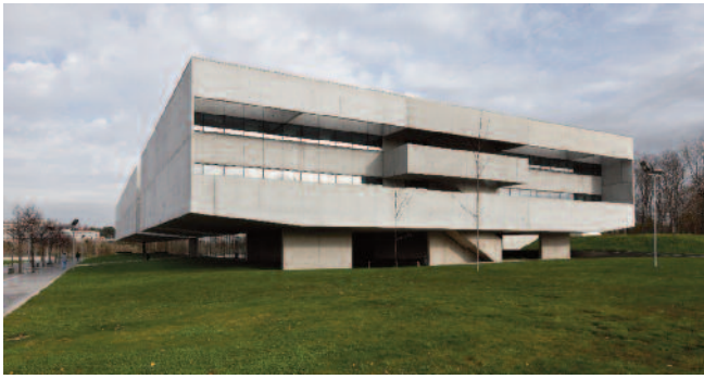
7 — I3S – Instituto de Inovação e Investigação em Saúde, Porto, Seródio Furtado Associados (Isabel Furtado e João Pedro Seródio).