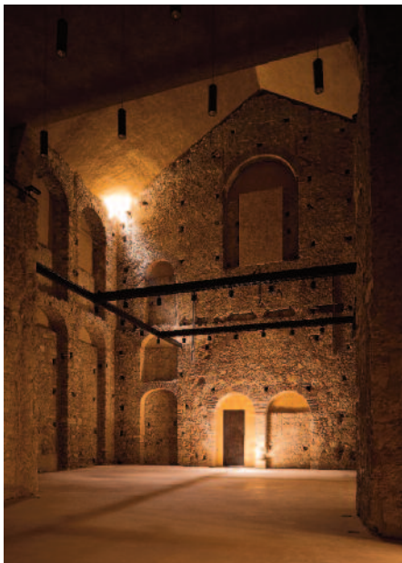
11 — Teatro Thalia, Lisboa, Gonçalo Byrne e Barbas Lopes Arquitectos (Diogo Seixas Lopes e Patrícia Barbas).