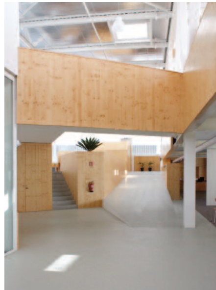
2 — Biblioteca Pública e Arquivo Regional de Angra do Heroísmo, Inês Lobo. Fotografia: Atelier Inês Lobo