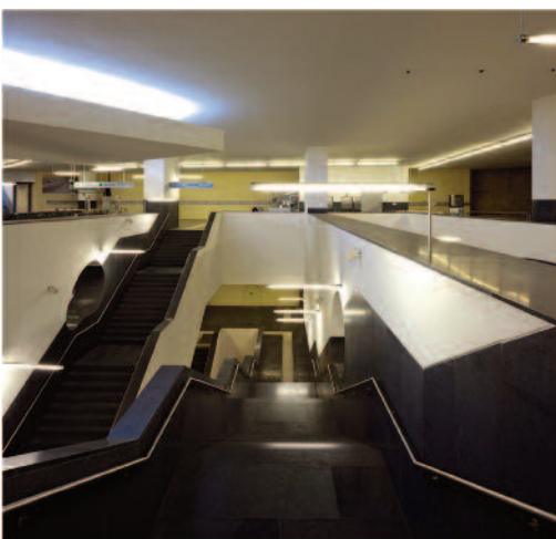
5 — Estação de Metro Município, Nápoles, Álvaro Siza, Eduardo Souto Moura e Tiago Figueiredo.