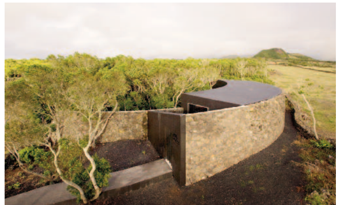
4 — Centro de Visitantes da Gruta das Torres, Pico, SAMI (Inês Vieira da Silva e Miguel Vieira).