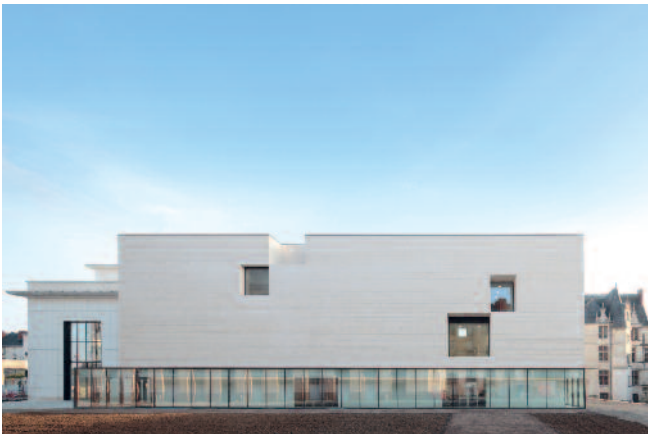
3 — Centro de Criação Contemporânea Olivier Debré, Tours, Aires Mateus e Associados (Manuel Mateus e Francisco Mateus).