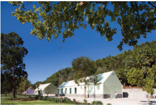
9 — Pavilhões de parque, no Parque Urbano de Albarquel, Setúbal, Ricardo Bak Gordon.